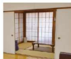
お付き添い(2F仮眠施設)